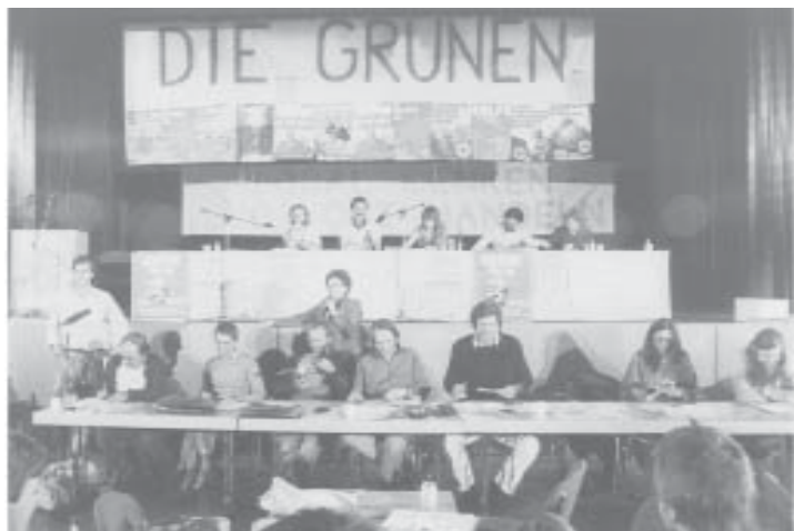
Landesdelegiertenkonferenz der Grünen