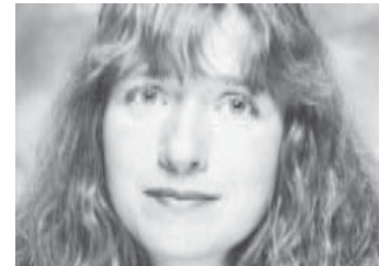
Die Autorin ist nicht Oberbürgermeisterin der Landeshauptstadt Hannover, sondern Vorsitzende von Bündnis 90/Die Grünen Kreisverband Hannover-Stadt. Sie ist OB-Kandidatin - aber nur in der BILD-Zeitung.