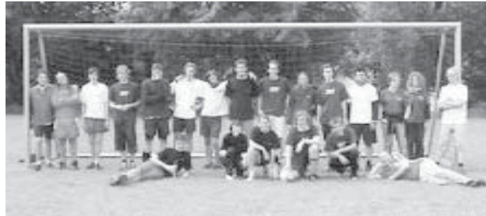
Ein starkes Team und immer in Aktion - Die Grüne Jugend Hannover

ren mussten, trafen wir auf ihn (ein sehr netter Mensch). Die Aktion wurde auch durchgeführt (trotz der schlechten Verhältnisse).