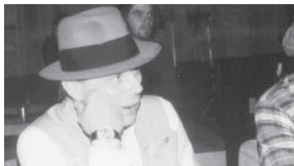
Joseph Beuys auf dem Gründungsparteitag der Grünen