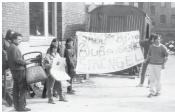
Aus Solidarität mit den Besetzern des Sprengelgeländes hat die GABL 1988 auf dem Gelände eine Außenstelle eröffnet. Die Stadt hat es nicht genehmigt - aber das Sprengelgelände gibt es noch heute.