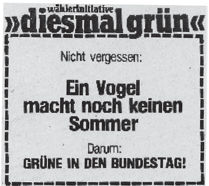
Oben: Anzeige der Wählerinitiative "diesmal grün" zur Bundestagswahl 1983.