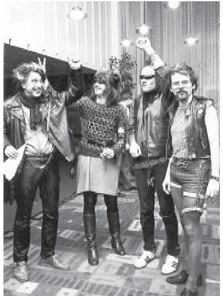
1982 erscheinen die Ratsleute der GABL aus Protest gegen die von der Landesregierung geplante Punkerdatei als Punker verkleidet im Rat

Zuerst zogen wir uns T-Shirts über. Das brachte eine heftige Diskussion über die Kleiderordnung in Gang. Der Oberbürgermeister sah darin eine nicht zulässige Demonstration. Im zweiten Versuch hefteten wir uns ein großes gelbes Holz-X vor die Brust. Auch das wurde untersagt. Aber unseren Auftritt gegen die Castor-Transporte hatten wir.